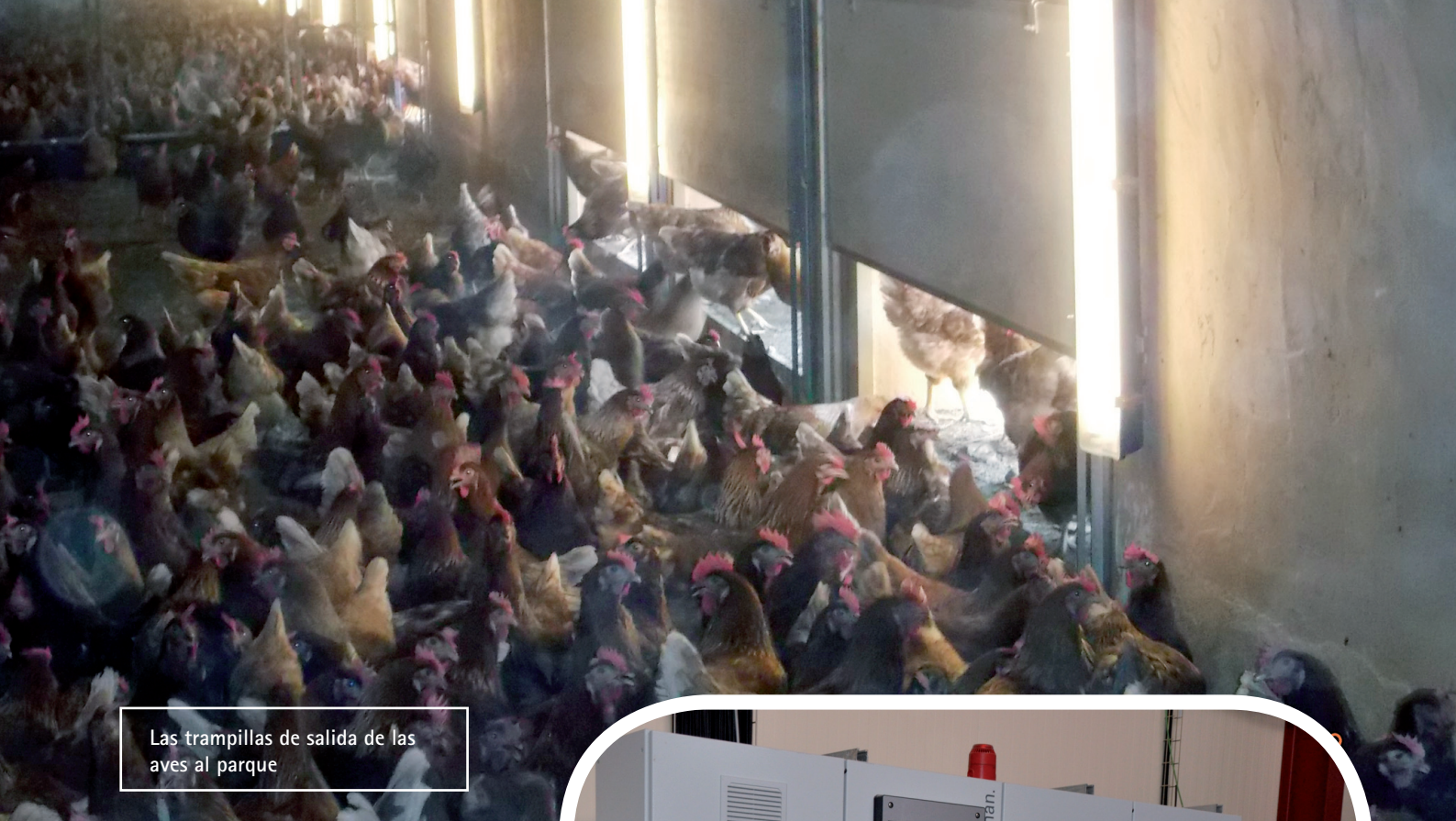
Las trampillas de salida de las aves al parque

al instalar a las pollitas en la nave estas deben encerrarse temporalmente en la zona abarcada por el equipo del aviario, sin acceder a la zona de yacija, con el fin de adaptarse mejor al sistema en el que tienen todo lo que necesitan, con un fácil acceso a los nidales, bebederos y comederos.