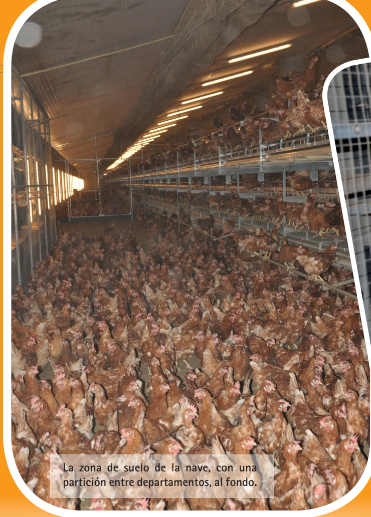
La zona de suelo de la nave, con una partición entre departamentos, al fondo.