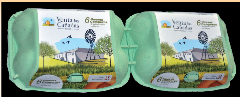
Los estuches de media docena de huevos (L + M) de "Venta Las Cañadas"

Siendo la capacidad de la nave para 30.500 gallinas, en la superficie total disponible de la misma, 2.128 m 2 la densidad de población resultante es de unas 14,3 gallinas/m 2 . Por tanto, resulta bastante superior a las 9 aves/m 2 que autoriza la legislación actual -en superficie disponible-, lo que representa precisamente una de las principales ventajas de este sistema de explotación, apto tanto para gallinas en el suelo -produciendo huevos de código 2- como para gallinas camperas -con huevos código 1-.