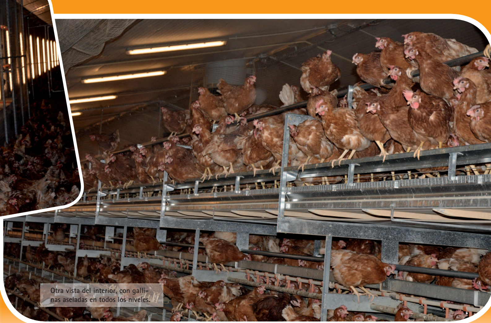
Otra vista del interior, con gallinas aseladas en todos los niveles.

En cuanto al aviario Natura-Nova Twin, su configuración es parecida a la de las otras versiones de Big Dutchman, pero más compacta. En él, las gallinas disponen del espacio necesario para aselarse, acceder al pienso –repartido en comederos de canal– y al agua –suministrada por bebederos de tetina– y poder introducirse en los nidales, estos con recogida de huevos mecanizada mediante las correspondientes cintas que los conducen hasta el centro de clasificación.