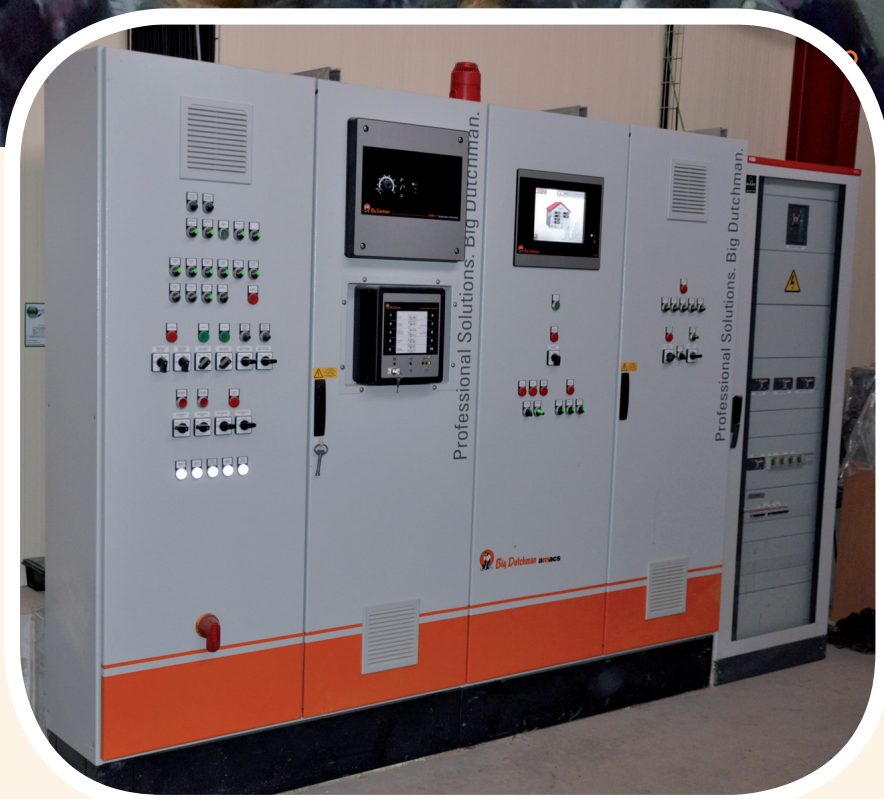
El armario con el ordenador y los equipos de control de la nave.

En la actualidad esta manada se halla aun en el 90 % de producción, habiendo tenido hasta la fecha solo alrededor de