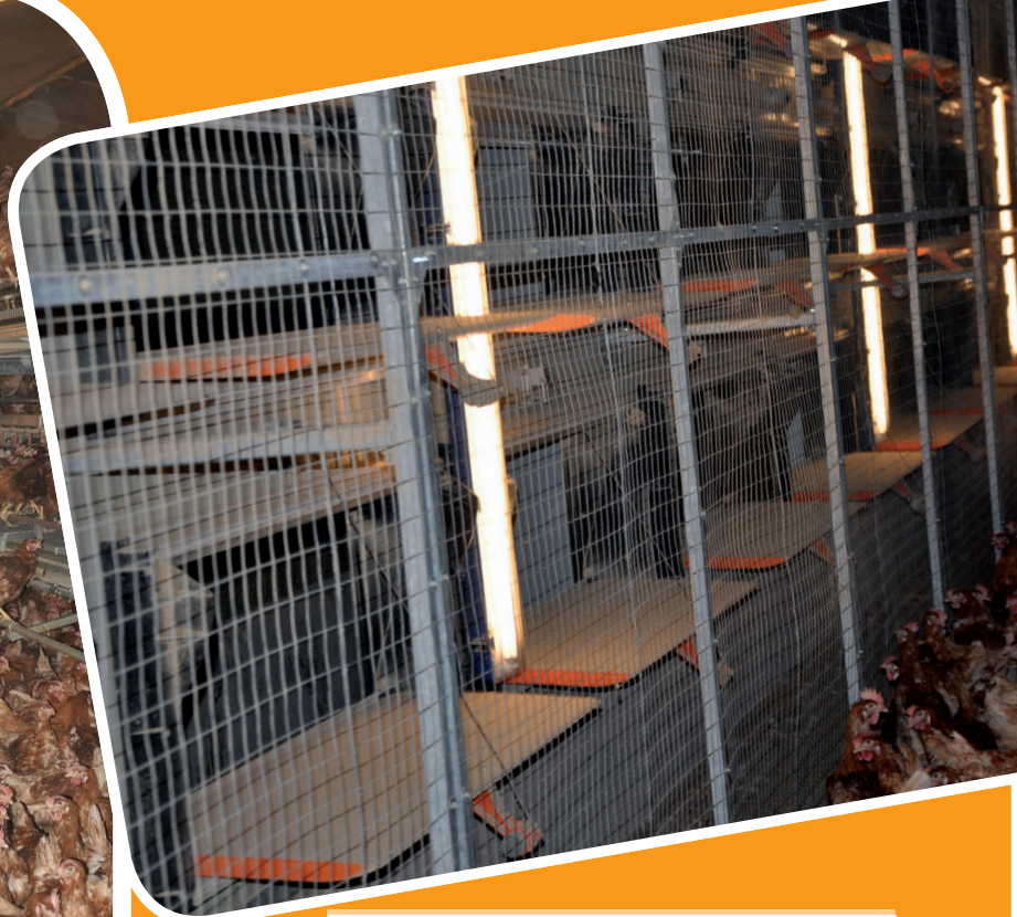
Detalle de las trampillas de entrada de aire para una ventilación túnel

su granja, un aviario para 30.500 gallinas, con el correspondiente centro de clasificación, este último ya adaptado para la ampliación futura que se proyecta.