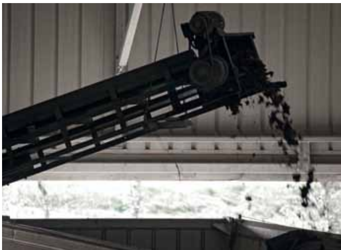
> Almacenamiento sobre carro de extracción