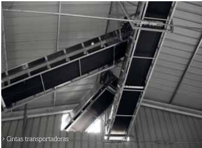
> Cintas transportadoras